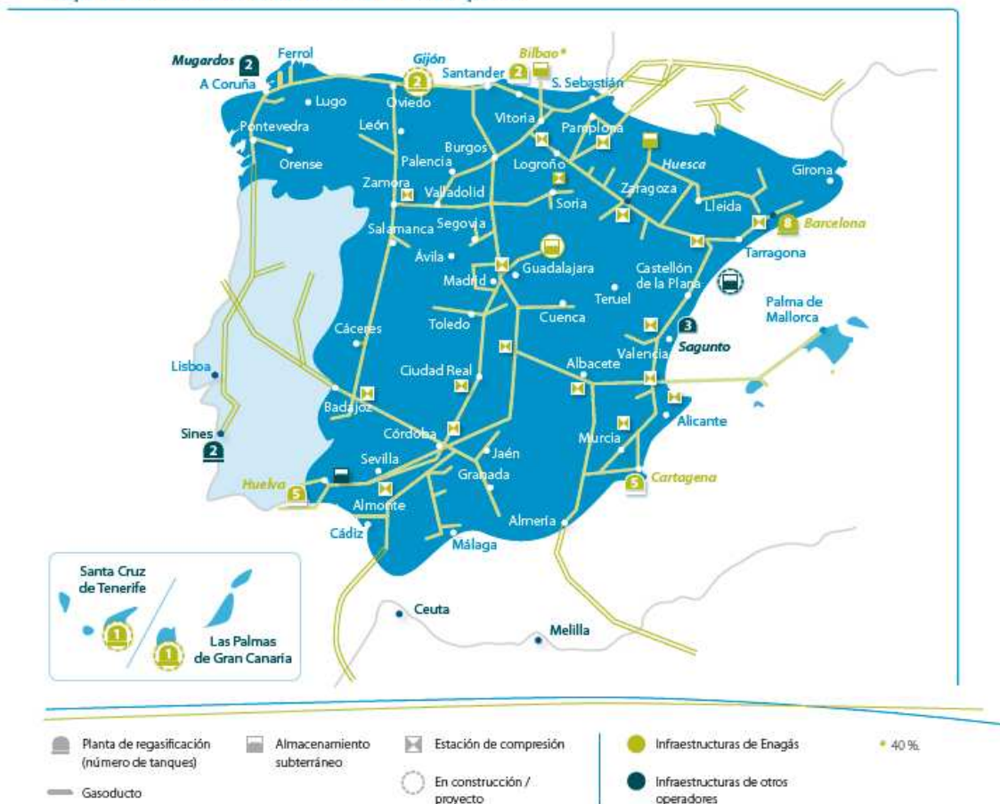
Mapa de infraestructuras del Sistema Gasista Español

Nota: Enagás participa con un 40% en la planta de regasificación de BBG, que actualmente dispone de dos tanques de almacenamiento de GNL con capacidad cada uno de 150.000 m 3 y una capacidad nominal de regasificación de 800.000 m 3 (n)/h.